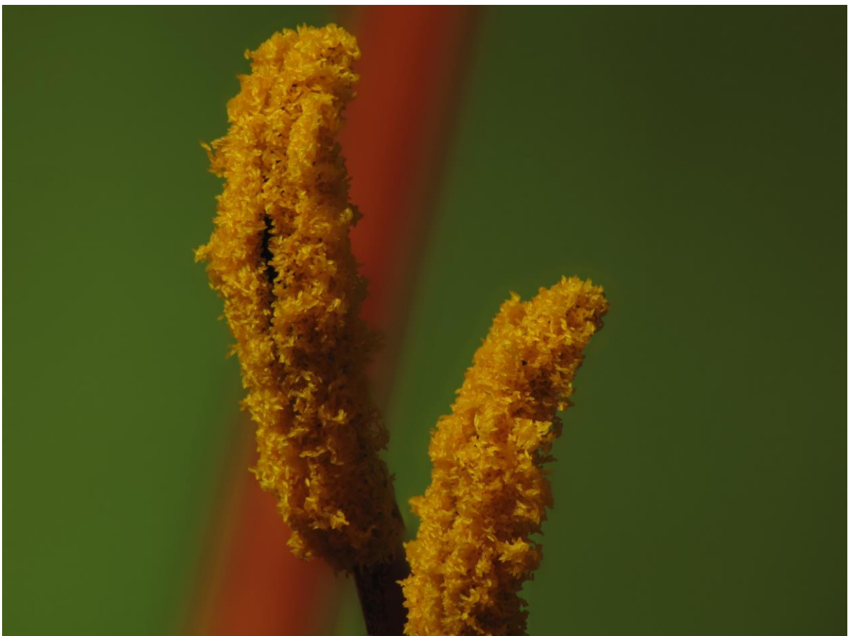
SX1: Staubgefäße einer Taglilie