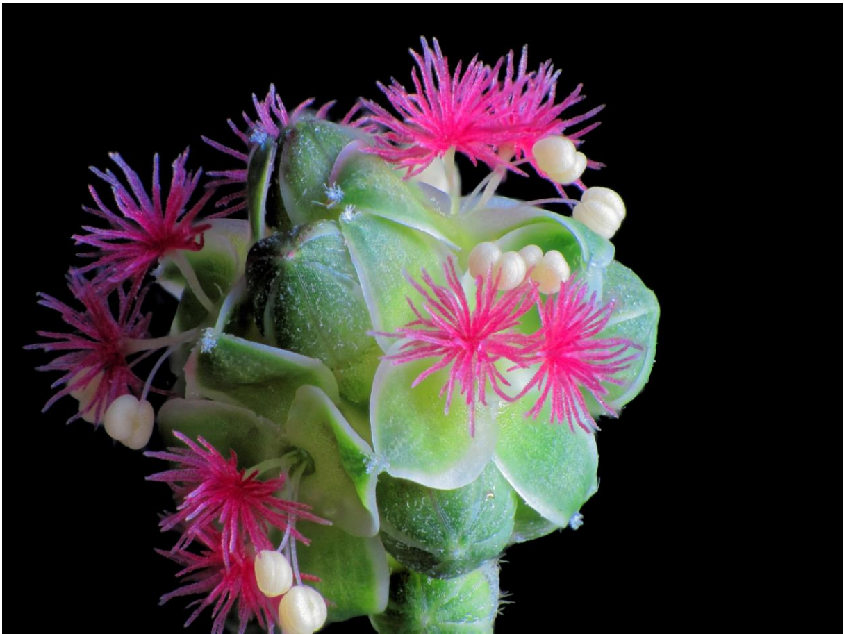
SX1: Blüte der Gartenpimpinelle