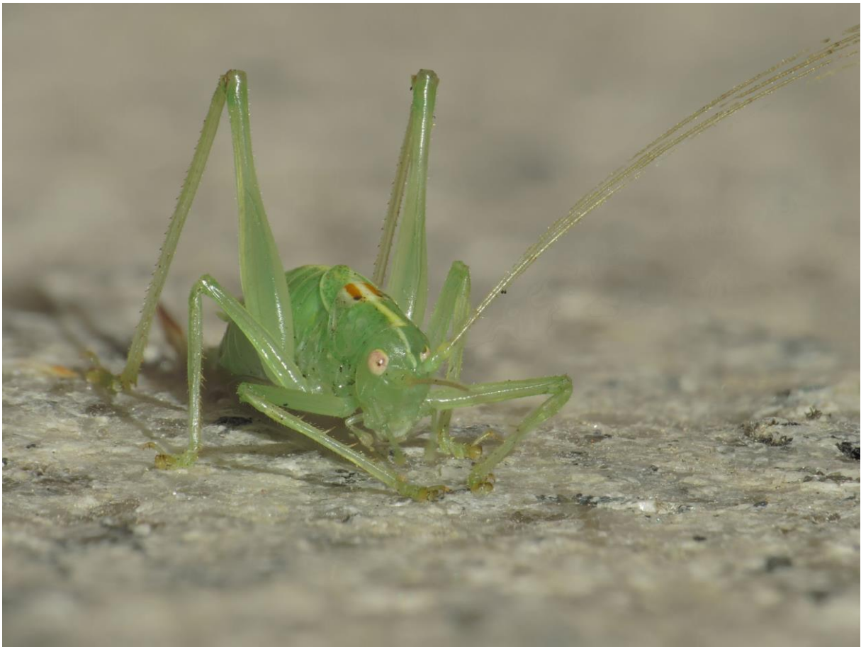
SX50: Heupferd mit nicht korrigierten Fühlern